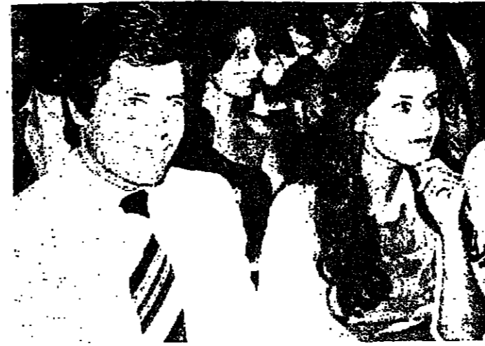
حسين فهمي مع ميراث امين

ومن هنا نشأت السينما المصرية خلال أبطالها الإوائل بيزة مينة من ان أكثر أبطالها من اولاد الثروات والبرجوازية المصرية الغنية الى العصر والحكم ذلك الوقت .. ومن هذا المنطلق يظهر يوسف بك وهبي بكل نشاطه الريحية الشهيرة وكذلك السينمائية تلك التي يقدم بهاها تجربة اولاد البوم المصري ومسعى تجرية اولاد الذوات ذلك الفيلم الذي تم تصويره في مصر وسجل الصوت على اجزاء منه في باريس فكان جزءه من ناطق حمرى .. ناطق حمرى يوسف وهبي كل المسرحيات العالمية تقريباً الى ان اطلقه بطلها .. ويخشى النظر من التقييم التقني لذلك الافلام سلاحاً انها كانت تجربة ثرية بالتعلم ومؤثرة نلت كل ما يحلم الافلام الشعبية الى الشاشة والذات المصرية الملمة بما اسبب السينما جمهوراً واسماً وقاعدة مريضة لا يستهان بها .